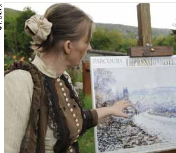
Parcours impressionniste à Vétheuil.