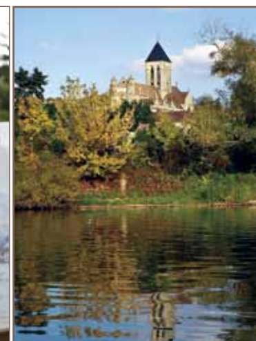
Eglise de Vétheuil.