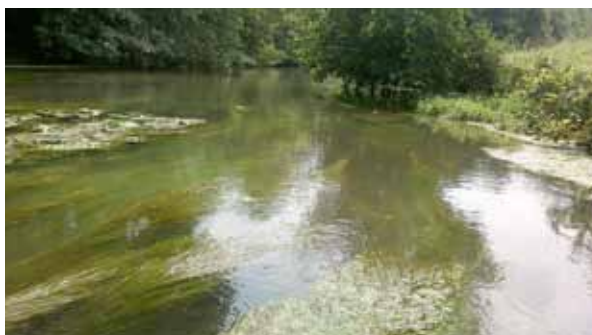
Végétation aquatique de l'Epte

Le Conservatoire Botanique National du Bassin Parisien (CBNBP) réalise des inventaires de la flore et des habitats naturels. En 2014, les botanistes du CBNBP ont réalisé avec l'aide du Parc, l'inventaire de la végétation aquatique de l'Epte (de Saint-Clair-sur-Epte jusqu'à la Seine). Les herbiers présents dans la rivière ont été déterminés, listés et cartographiés. L'Epte représente ainsi l'habitat Natura 2000 « 3260 : Rivière courante à Renoncule aquatique et Potamots ».