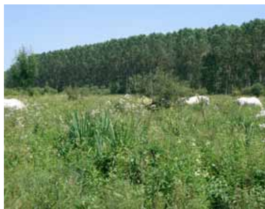
Marais de Frocourt : milieu ouvert et forestier