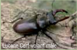
Lucane Cerf-volant mâle

Le Lucane Cerf-volant ( Lucanus cervus ) est le plus grand coléoptère d'Europe et est facilement reconnaissable à ses mandibules très développées, rappelant les bois du cerf. Se nourrissant principalement de bois mort de chênes, mais aussi d'autres feuillus, on le trouve proche des souches et des vieux arbres dépérissant.