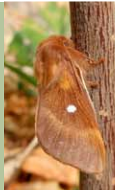
Laineuse du prunellier adulte

Vous croyez avoir vu un Lucane Cerf-Volant ou une Laineuse du prunellier ?