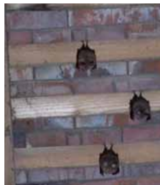
Petits rhinolophes dans un toit de bâtiment

Vous aussi, vous avez des chauves-souris chez vous ? Dites-le nous !