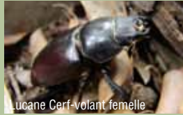
Lucane Cerf-volant femelle

La Laineuse du prunellier ( Eriogaster catax ) est un lépidoptère hétérocère, c'est-à-dire un papillon nocturne ou papillon « de nuit ».