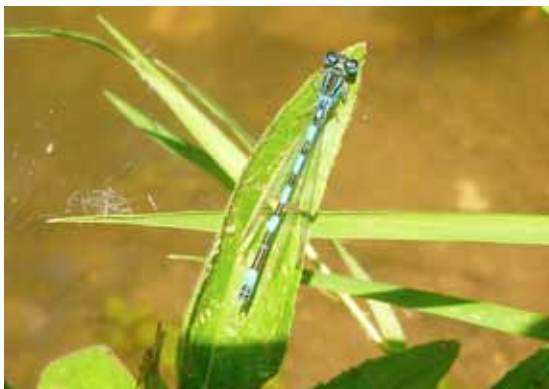
Agrion de mercure

Malgré sa petite taille et sa discrétion, l'Agrion de mercure est emblématique de la vallée de l'Epte. Cette demoiselle affectionne les petits cours d'eau courant ensoleillés et entourés de prairies aux mois de juin et juillet. Pour mieux connaître leur répartition sur le site de la vallée de l'Epte, un suivi des populations et de l'état de conservation des cours d'eau a été réalisé par une stagiaire durant l'été 2014.