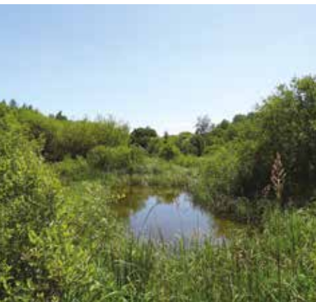
Espace Naturel Sensible (ENS) du marais de Frocourt (95)