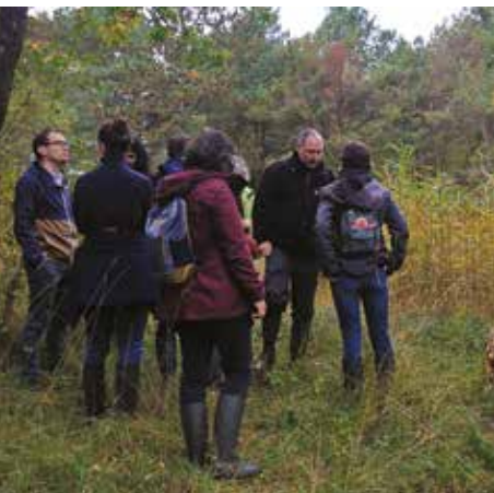
Visite de l'Espace Naturel Sensible de la Butte du Hutrel (78)