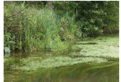
Rivière à renoncules

Les mesures de gestion proposées par le Document d'Objectifs incluent ainsi des travaux de renaturation des rivières (restauration des méandres et bras morts, de la diversité physique des cours d'eau), des mesures destinées aux espèces piscicoles (effacement des obstacles à la migration, restauration des zones de frayères), et des mesures de restauration et entretien de la végétation aquatique et des ripisylves (végétations des berges).