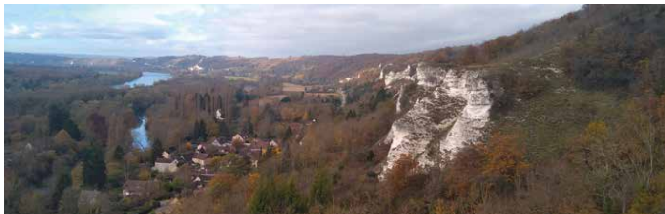
Vue sur les pitons crayeux de la Réserve naturelle nationale des coteaux de la Seine