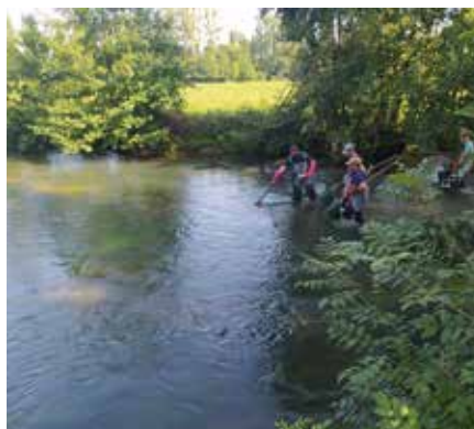
Inventaires piscicoles réalisés par la FDPMA27 dans le cadre de la révision du DOCOB de la Vallée de l'Epte