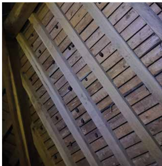
Nurserie de Petits Rhinolophes

Durant près de deux heures, les 25 participants ont pu découvrir le monde fascinant de ces petits mammifères nocturnes, et se familiariser avec les espèces qui fréquentent le territoire. Malgré les conditions météorologiques difficiles, la soirée s'est terminée par une déambulation dans le village à la recherche de ces petites bêtes discrètes mais utiles !