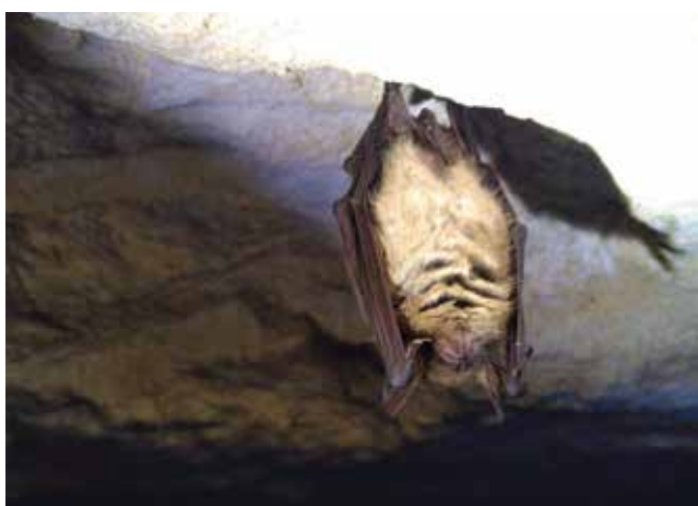
Murin à oreilles échanquées

Louise-Anne a donc établi des cartographies des territoires de chasse potentiels autour de chaque nurserie connue, en évaluant l'intérêt de chaque habitat pour l'espèce concernée. Les résultats de cette étude permettront une meilleure prise en compte des enjeux chiroptères en période estivale dans les sites Natura 2000, et des informations sur les zones à enjeux à protéger dans le cadre de la nouvelle Stratégie de création d'Aires Protégées.