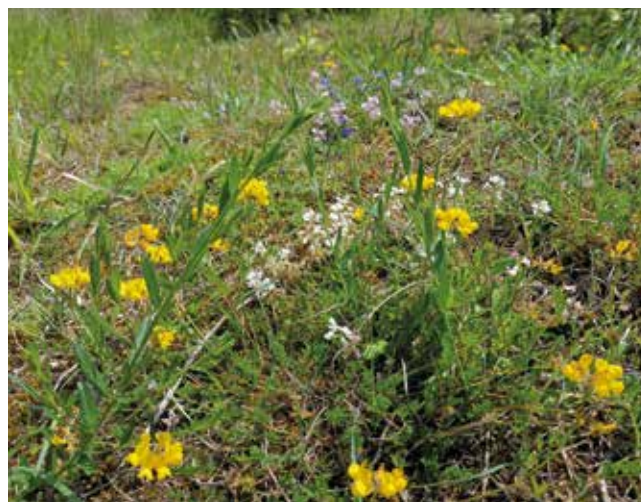
Pelouse fleurie de la butte du Hutrel (78)

Leur mise en œuvre se fait ensuite selon une démarche volontaire et contractuelle, basée sur la signature de contrats, financés par les régions et l'Union Européenne, ou de chartes, afin de mettre en place des actions de gestion et d'encourager le développement de pratiques favorables à la biodiversité.