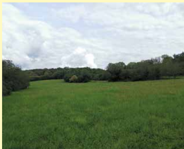
Prairie engagée en Mesure Agro-Environnementale et Climatique

Les campagnes précédentes ont rencontré un grand succès, avec une centaine d'agriculteurs du territoire engagés dans des mesures de réduction de traitements phytosanitaires, de création ou de gestion de prairies, d'entretien de haies, mares, fossés, ou vergers, entre autres. Le nouveau PAEC continue sur cette lancée, avec sur sa première année une soixantaine d'agriculteurs reconduisant des mesures ou s'engageant pour la première fois dans le dispositif.