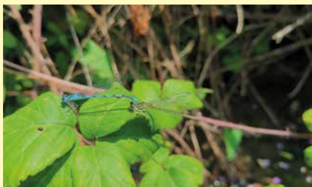
Couple d'Agrions de Mercure

Ces informations permettront à terme d'établir un cahier technique, accessible à toute personne souhaitant réaliser des entretiens de cours d'eau ou fossés dans le respect de la biodiversité.