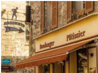
Maison du Pain à Commeny