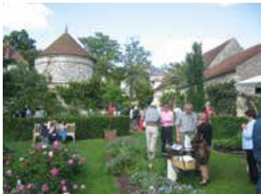
Jardin de Campagne