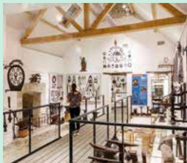
Musée de l'Outil