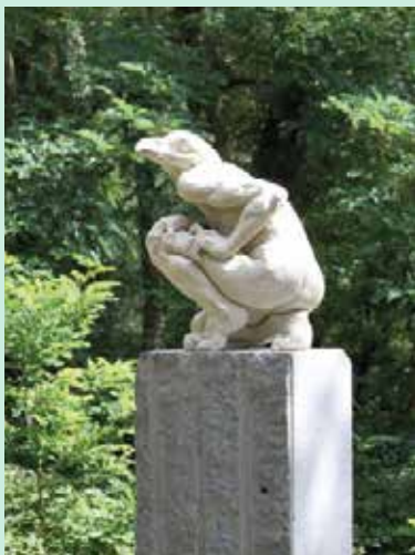
Sculpture d'Arnaud Kasper