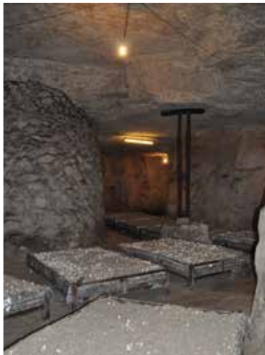
Champignonnière des carrières à Evéquemont