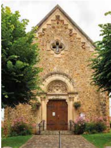
Eglise de Brueil-en-Vexin