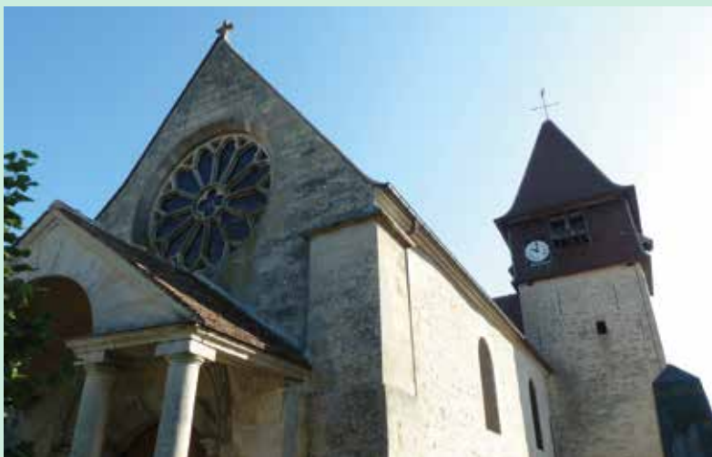
Eglise de Labbeville