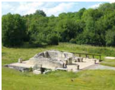
Site archéologique des Vaux-de-la-Celle