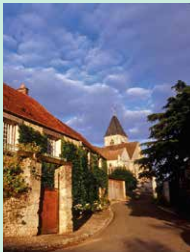
Eglise de Chérence