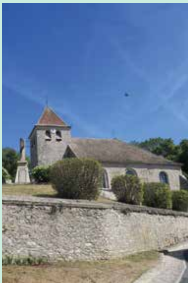
Eglise de Saint-Cyr-en-Arthies

Renseignements : Association pour l'église de Saint-Cyr-en-Arthies 06 16 89 33 51