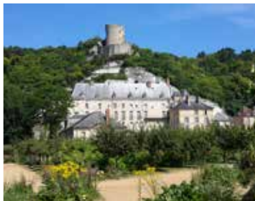
Château de La Roche-Guyon