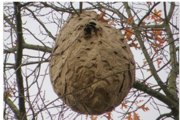
Nid secondaire, construits après le mois de juin (ouverture sur le côté du nid)

La Communauté de Communes Vexin-Val-de-Seine a voté un budget dédié permettant aux communes de déclarer les nids présents sur leur territoire. La CCVVS mandate alors une entreprise agréée spécialisée et en assume le coût (ce uniquement pour les frelons asiatiques). La CCVVS peut également financer les services des Sapeurs-Pompiers compétents en la matière et équipés pour ce type d'intervention.