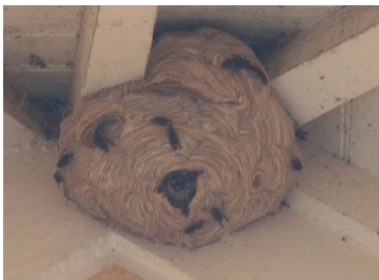
Nid primaire (ouverture sous le nid)

S'il apparaît désormais illusoire d'envisager l'éradication de l'espèce il est possible d'intervenir par piégeage ou destruction des nids pour en limiter l'expansion.