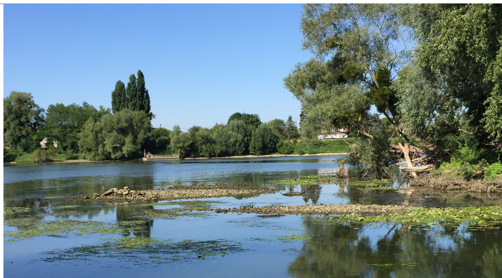
La pointe de l'île découverte, le 4 août.

Si le bac rencontre toujours un grand succès, les conditions de navigation posent quelques problèmes. En effet, le niveau de la Seine connaît de grandes variations qui entraînent des difficultés d'appontage, sur Moisson, principalement. C'est ainsi qu'en juillet et jusqu'à la mi août, le bac n'a pas toujours pu assurer sa mission entre Vétheuil et Lavacourt. Dans une même journée, on a constaté des variations de niveaux de plusieurs dizaines de centimètres. Ainsi le bac n'a pas pu fonctionner des journées complètes. Nous n'atteindrons donc pas les chiffres records de l'an dernier mais au 31 août nous avons déjà effectué quelques 1 720 traversées pour 12 000 passagers.